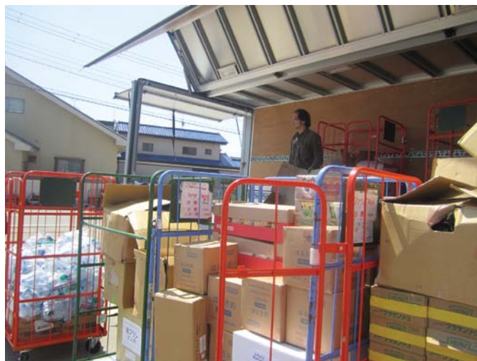
石巻市鹿妻での物資配布準備風景（4月）