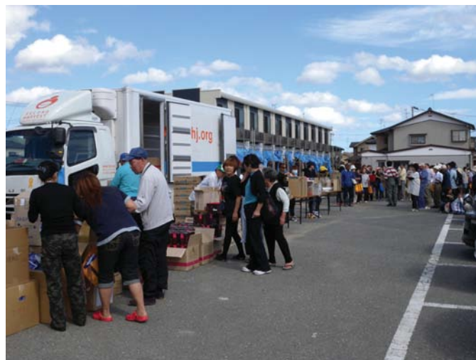
物資配布会の様子

震災から約8ヶ月が過ぎ、震災当初と比べるとだいぶ瓦礫が撤去され、きれいになってきました。