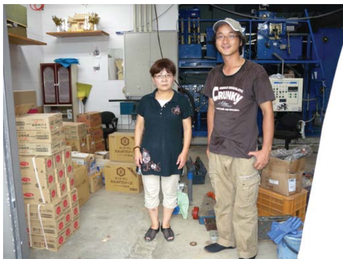
在宅避難者への配送に協力してくださっている方への物資お届け