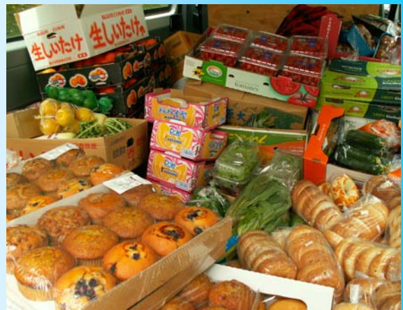
必要な栄養 シェルターにおいて、新鮮な野菜やパンは歓迎されます。

食べ物は物理的な面だけでなく、精神的な面でも入所者の力になっています。夫から暴力を受けたり、厳しく生活を規制されてきた人たち。あるいは、食費を切りつめて好きなものを食べることができなかった人たち。たくさんの食事を前に「自分で選んで、好きなだけ食べていいのよ」といわれることは、彼女たちにとっては何よりもうれしいことだ、といいます。