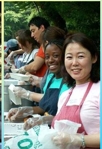
みんな笑顔で ボランティアたちは、上野公園で配給に並ぶ人たちと冗談を言ったりして笑顔を交わしています。