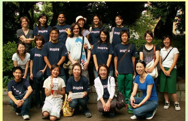
他者をインスパイア(感化)する熱意 モルガン・スタンレーの従業員が、土曜の炊き出し活動に参加しました。

提案はすぐさま行動に移され、それ以来モルガン・スタンレーは常にセカンドハーベストジャパンの頼れる、そして協力的な資金援助面での“大黒柱”であり、資金援助面以外にも多方面において活動を行動で支える、いわば“活動世話役人”でありつづけています。彼らの活動の一例を以下の表にまとめてみました。